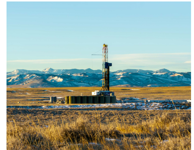
Bohrarbeiten von Bright Rock Energy

Zum 30. Juni 2024 setzte sich der Deutsche-Rohstoff-Konzern aus den folgenden wesentlichen Konzerngesellschaften und Beteiligungen zusammen. Als wesentlich werden solche Tochtergesellschaften und Beteiligungen angesehen, die dauerhaft gehalten werden sollen.