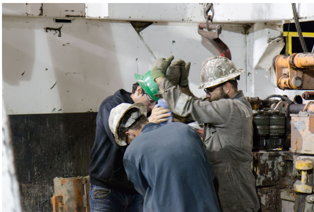
Bohrarbeiten von 1876 Resources

Wir konnten im ersten Halbjahr 14.763 BOEPD - Barrel Ölequivalent pro Tag - produzieren (Vorjahr 10.533 BOEPD). Dies entsprach im ersten Halbjahr einer Gesamtproduktion